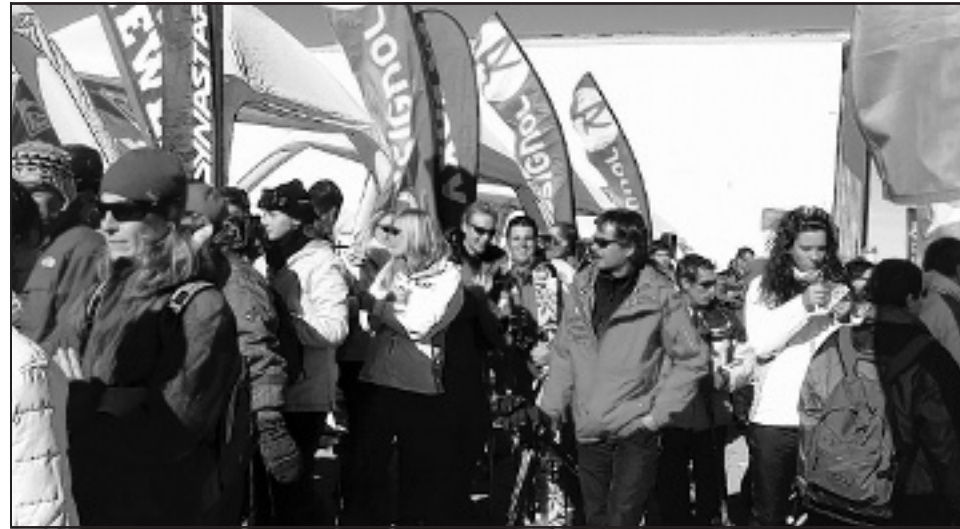
Il y avait affluence hier matin dans les allées du Salon. La compétition de ski freestyle a été un véritable show, pour cette première journée du Mondial.